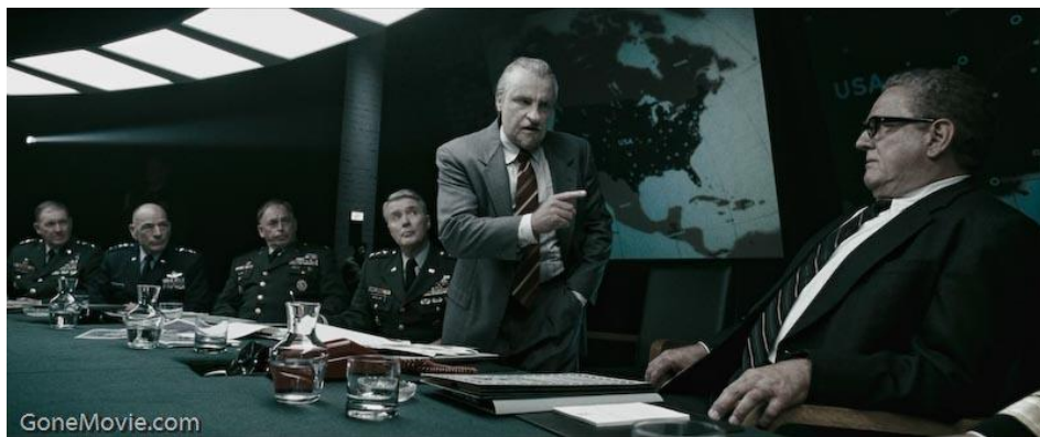
El cuarto de guerra de Nixon, en la película Watchmen (Zack Snyder, 2009)