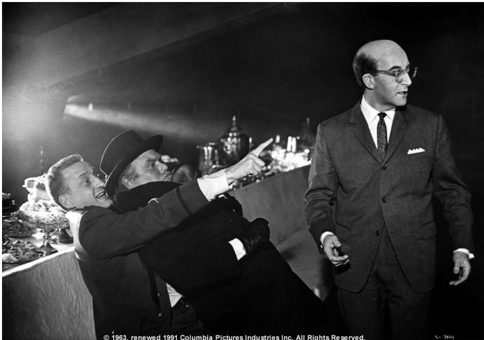
El cuarto de guerra del presidente de Estados Unidos, interpretado por Peter Sellers en " Dr. Strange Love " (Stanley Kubrick,