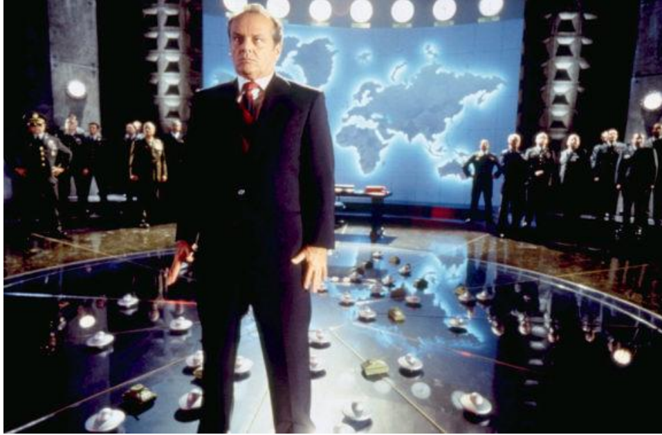
Jack Nicholson como el presidente Estados Unidos, en su cuarto de guerra siguiendo el ataque marciano en " Mars Attack! " (Tim Burton, 1996)

Objeto de Aprendizaje: ¿Cómo hablan los medios? Competencias Mediáticas Básicas